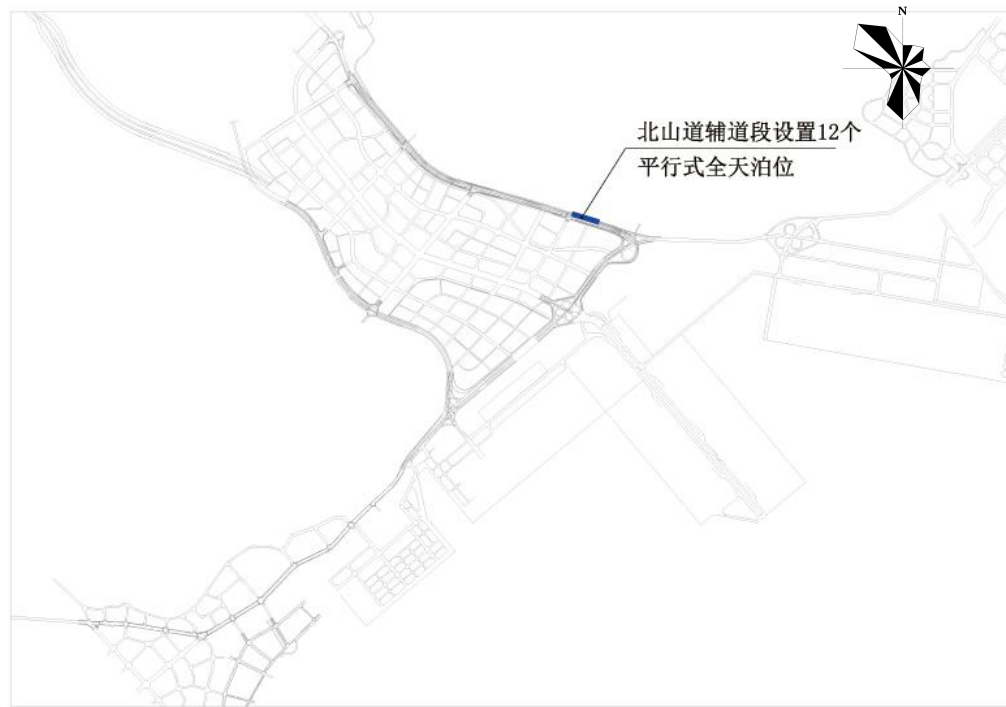
盐田区北山道辅道路边停车泊位规划示意图