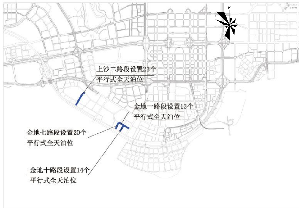
福田区上沙二路、金地十路、金地七路、金地一路路边停车泊位规划示意图