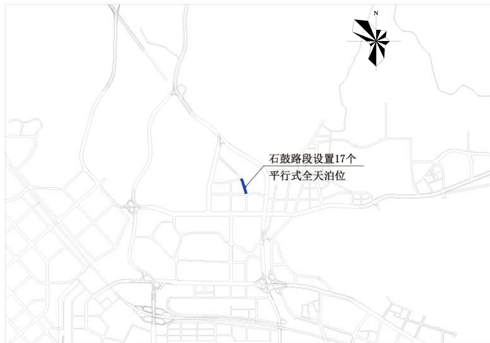
南山区石鼓路路边停车泊位规划示意图