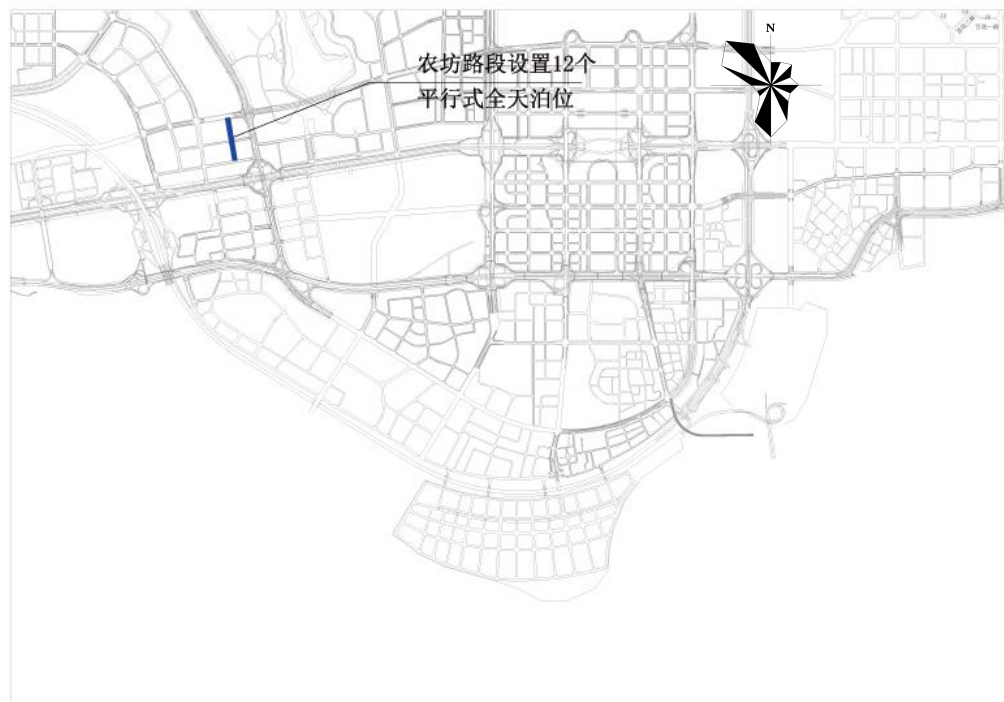
福田区农坊路路边停车泊位规划示意图