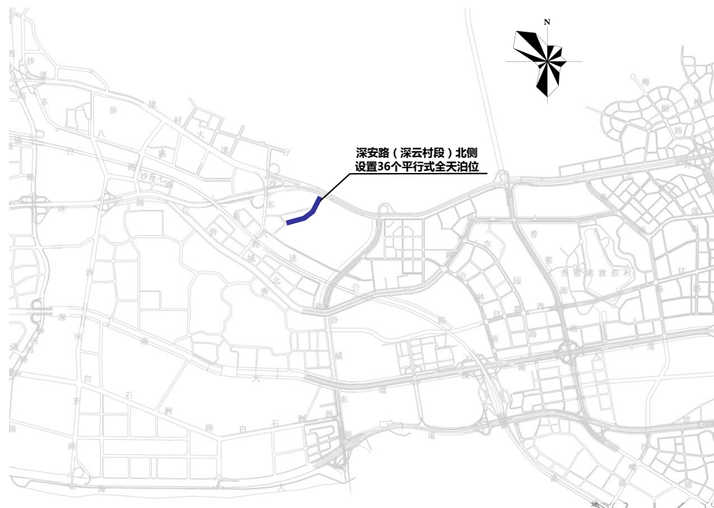
南山区深安路路边停车泊位规划示意图