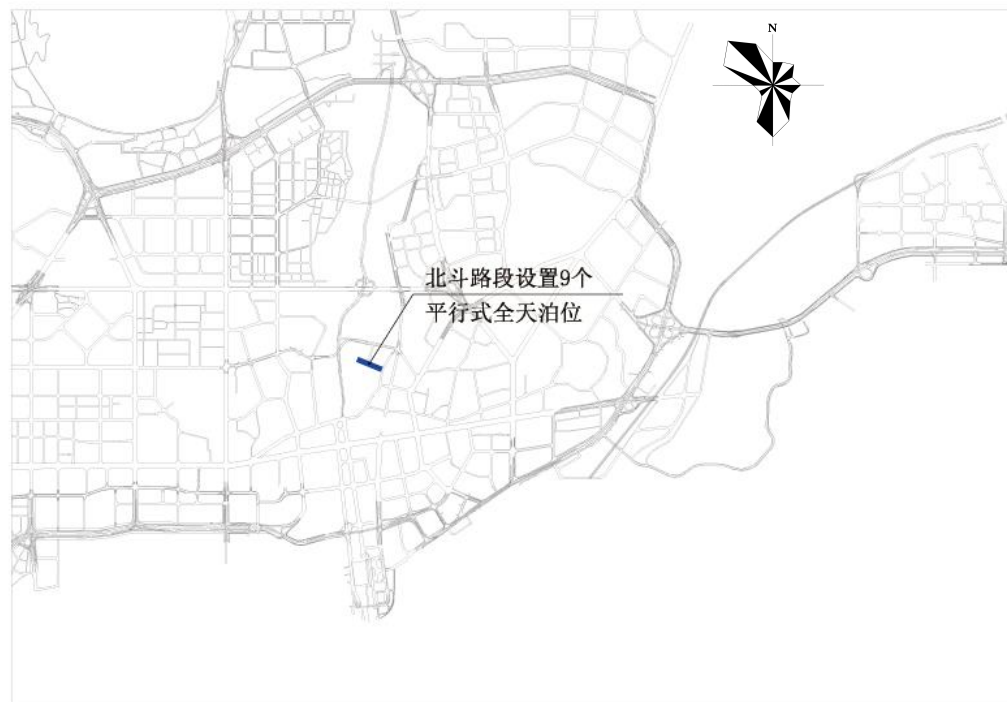
罗湖区北斗路路边停车泊位规划示意图