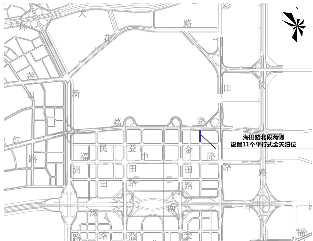
福田区海田路路边停车泊位规划示意图