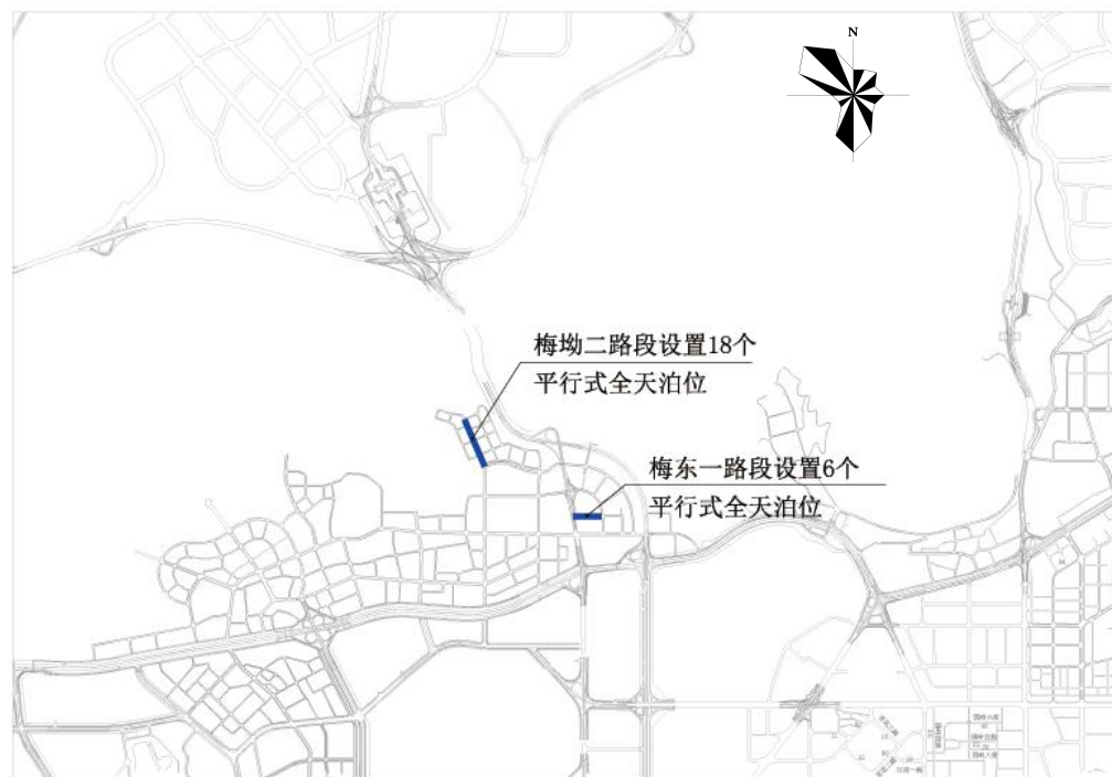
福田区梅坳二路、梅东一路路边停车泊位规划示意图