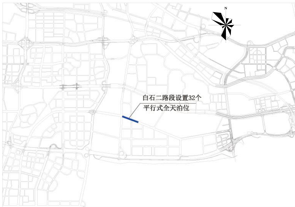
南山区白石二路路边停车泊位规划示意图