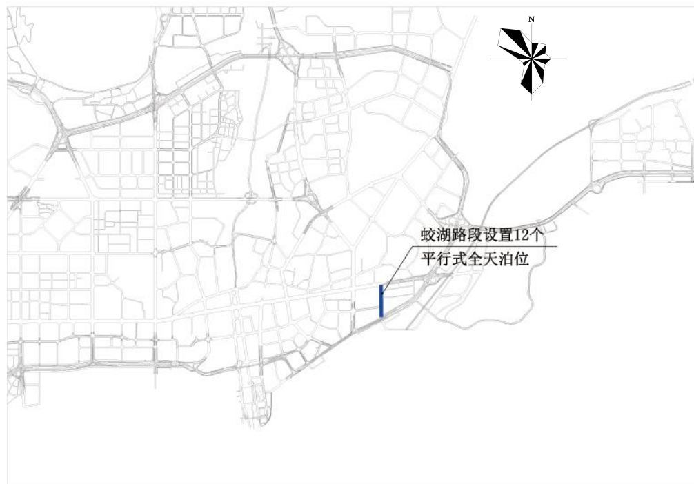
罗湖区蛟湖路路边停车泊位规划示意图