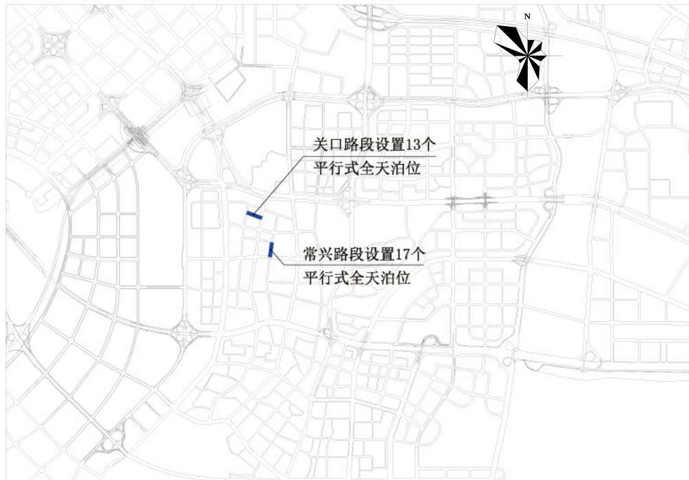
南山区关口路、常兴路路边停车泊位规划示意图